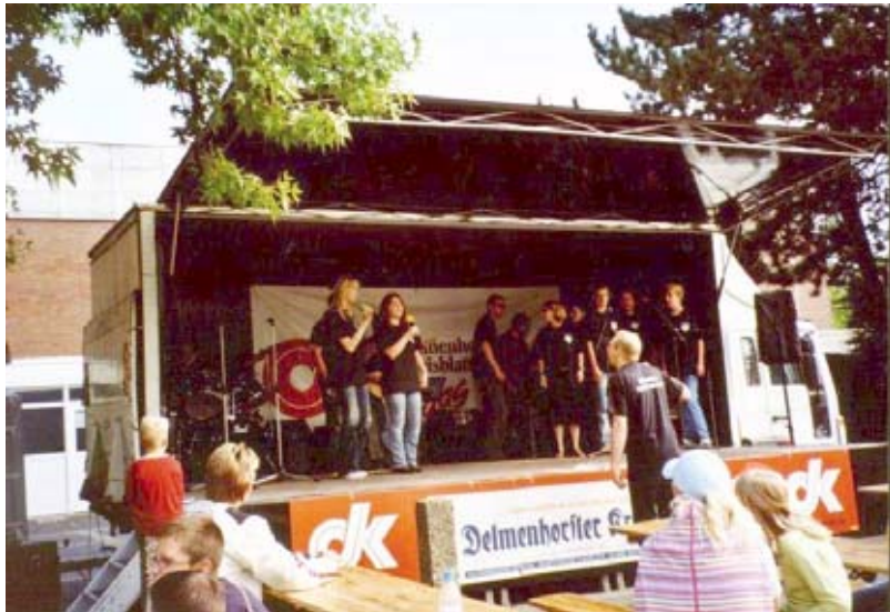
Neu seit Oktober 2004