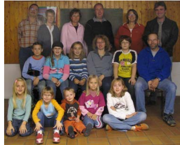
Seit Juni 2003