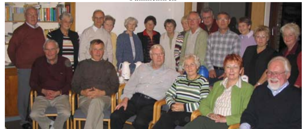
seit März 1975